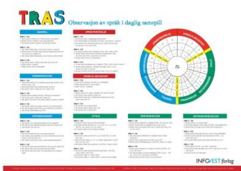
Figur nr.1. TRAS. Observasjon av språk i daglig samspill. Info Fest Forlag (2002)