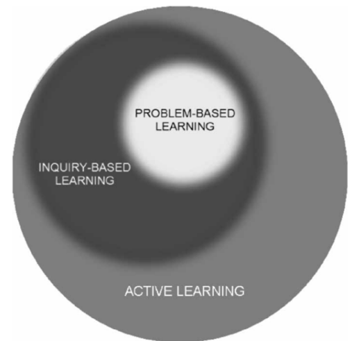
Figur 1: Forholdet mellom problemløsning og utforskende undervisning i aktiv læring (Spronken-Smith et al., 2008, s. 74).

Ifølge Skovsmose (2003, s. 147-149) befinner elevene seg i et undersøkelseslandskap hvis de ikke kan la være å stille undrende spørsmål som: «Hva skjer hvis?» og «Hvorfor er det slik?». Han mener at oppgavene må være laget slik at elevene blir invitert og fristet til å utforske. Det skal være elevenes undring som er styrende. Han mener at alle oppgaver kan være i et undersøkelseslandskap, men det krever at elevene tar imot invitasjonen. Skovsmose (2003)