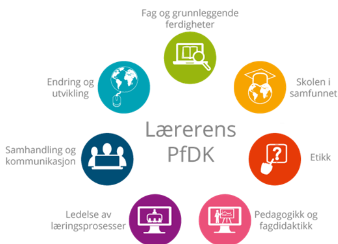
Figur 1: PfDK-rammeverkets syv kompetanser

For å imøtekomme kravene fra skolen og samfunnet om digitalisering, lanserte Utdanningsdirektoratet i 2017 et rammeverk for læreres profesjonsfaglige digitale kompetanse (Hjukse et al., 2020, s. 1). Dette rammeverket, kjent som Rammeverk for Profesjonsfaglig Digital Kompetanse (forkortet PfDK), ble utarbeidet gjennom et samarbeid mellom Utdanningsdirektoratet, forskningsmiljøer og internasjonale aktører (Hjukse et al., 2020, s. 4). PfDK-rammeverket representerer et profesjonsspesifikt og retningsgivende dokument, utformet med formål om å støtte lærere i blant annet rolleavklaring og etablering av et felles begrepsapparat i møte med digitaliseringen (Hjukse et al., 2020, s. 4; Udir, 2024, s. 3). Rammeverket består av syv kompetanser, som baserer seg på forventninger og krav fra nasjonale styringsdokumenter og nasjonal og internasjonal forskning (Udir, 2024, s. 4).