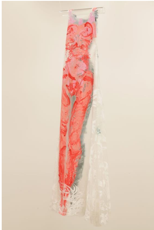
Verk av Elisabeth Haarr (Figur 1)