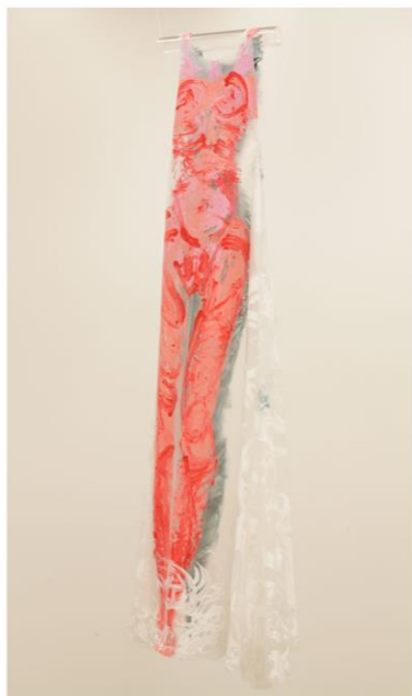
Figur 1. Verk uten navn, Elisabeth Haarr 2016, Oslo Kunsthall.