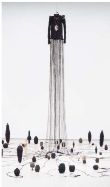
Figur 3. Arvegods, Kari Steihaug 2016, Contemporary Art Center Cincinnati