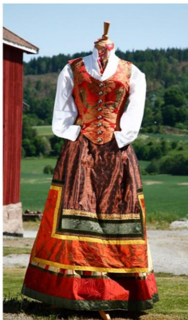
Figur 2. Verk uten navn, Lise Skjåk Bræk 2023, Galleri Soon