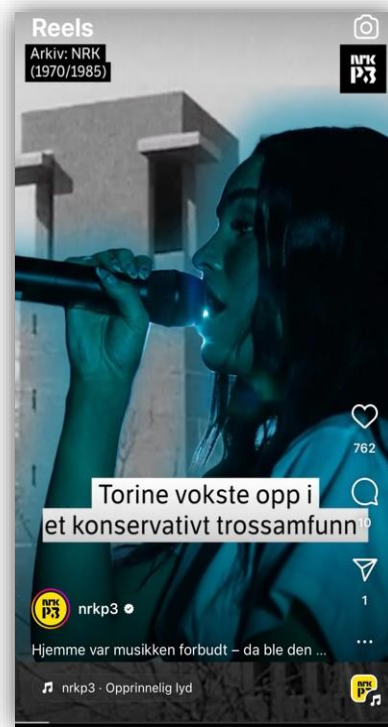
Bilde 4: Reel på Instagram