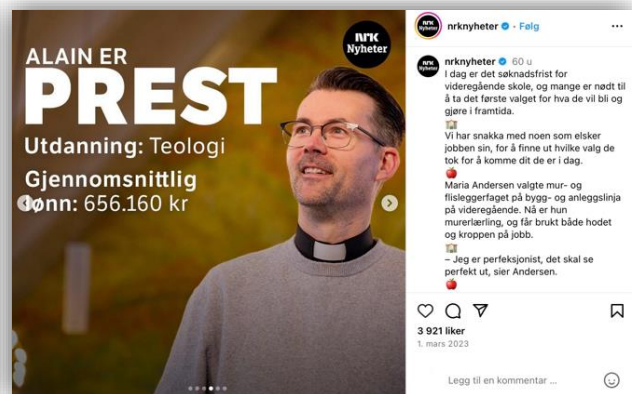
Bilde 6: Religion i mellomgrunnen.