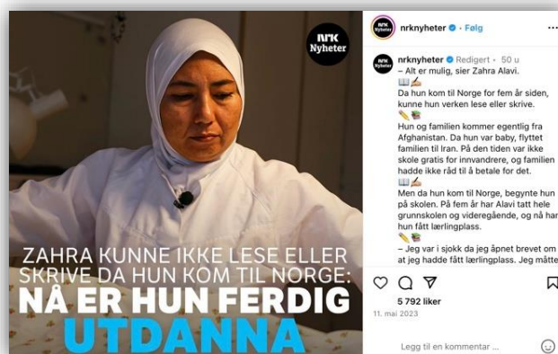
Bilde 7: Religion i bakgrunnen.