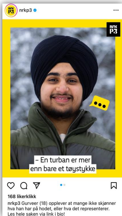
Bilde 3: Innlegg på Instagram

Bilde 3 og 4. Eksempler på de to formatene som er aktuelle i denne oppgaven. Skjermdump fra NRK P3 på Instagram, 5.januar 2024. (Hentet fra NRK P3, 2023a; 2023b)