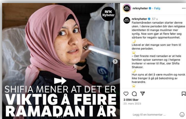
Bilde 5: Religion i forgrunnen.

Bilde 5, 6 og 7. Eksempler på religion som opptrer i forgrunnen, mellomgrunnen og bakgrunnen. Skjermdump fra NRK Nyheter på Instagram, 29.april 2024. (Hentet fra NRK Nyheter, 2023b; 2023c; 2023d)