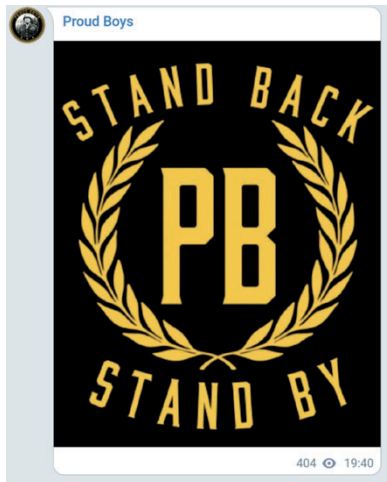
Et af de memes som opstod på Twitter efter Trumps udtalelse om Proud Boys. @Proud Boys.

back and stand by” og fortsatte udtalelsen med at tale om AntiFa-grupper i stedet. Frem for at fordømme Proud Boys syntes han at give en forsikring om, at de kunne stole på hans stiltiende støtte (DeCook, 2018). Trumps opfordring gav Proud Boys større opmærksomhed end nogensinde, hvis man ser på brugen af hashtagget på denne dag og i dagene efter på Twitter (Gallucci, 2020). Desuden blev udtalelsen omdannet til memes og slogans for Proud Boys-tilhængere.