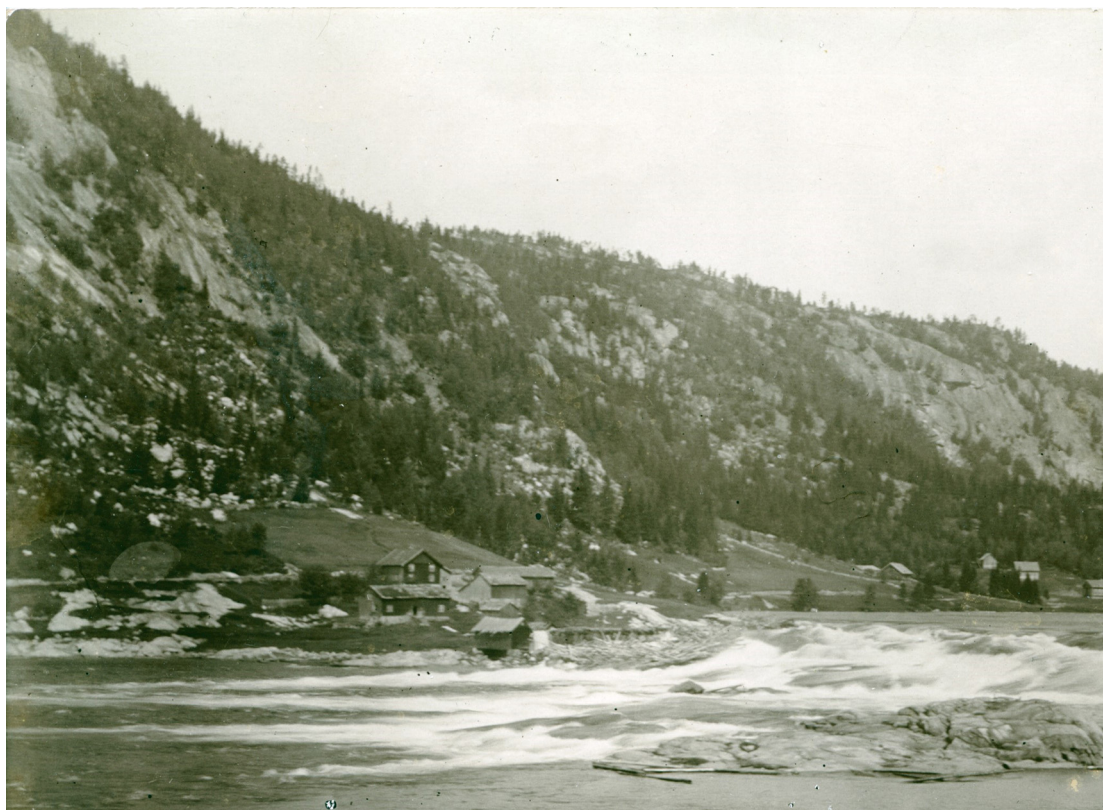
Bilde 3 Odden ved Fennefoss der haugianernes papirmølle i sin tid sto. Den langstrakte bygningen til venstre i bildet tjente som bolighus for arbeiderne ved mølla.