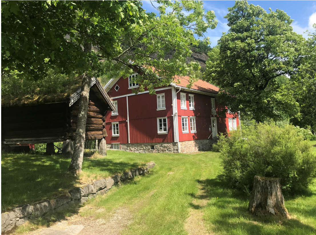
Bilde 1 Lensmannsgården på Fennefoss. Etter lokal tradisjon bodde Hans Nielsen Hauge her under sitt besøk i Evje og Hornnes seinhøstes 1803. Bygningen er nå en del av Setesdalsmuseet.