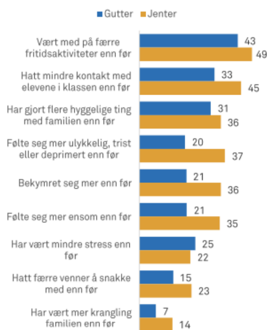
Prosentandel som opplevde at pandemien påvirket ulike sider ved hverdagslivet. Blant gutter og jenter

Tabell hentet fra Bakken (Bakken, 2021, s.11)