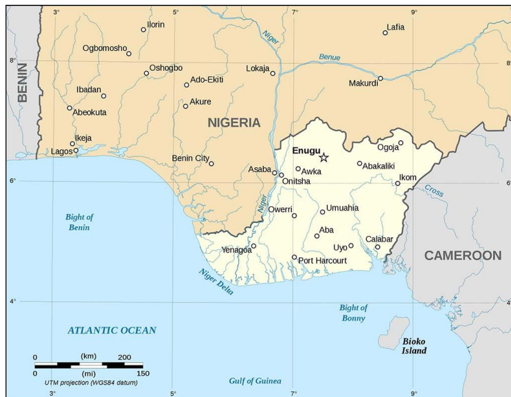
Figur 4: Kart over Biafra. 247

Nigeria fikk sin uavhengighet fra det britiske imperiet 01.10.1960. Nigeria var i likhet med mange andre tidligere kolonier i Afrika et multietnisk og multireligiøst land. Islam i nord og kristendom i sør. Helt i sørøst i landet på grensen til Kamerun ligger et område som heter Biafra. Dette området var befolket av primært kristne Iboer. I likhet med mange andre etniske grupper i postkoloniale Afrika hadde Iboene anstrengte forhold til andre etniske grupper i sitt eget land. I Iboenes tilfelle var disse Yorubaene som bodde på vestbredden av Nigerelven, og en rekke forskjellige muslimske folkeslag i nord.