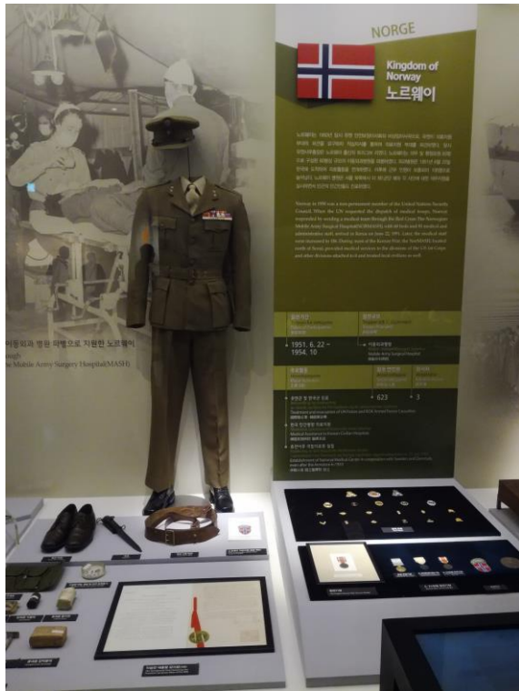
Figur 3 Norsk uniform som NORMASH-personell typisk ville være iført. 225

På dette bilde ser vi en uniform som norsk personell typisk ville brukt, med ulike emblemer på, avhengig av om vedkomne tilhørte Røde Kors eller forsvaret. Legg spesielt merke til dette ikke er en feltuniform, slik som en soldat ville hatt på seg i kamp. Dette er en typisk tjenesteuniform, tilsvarende det forsvaret i dag kaller en «K1-uniform», altså en uniform som vanligvis brukes av kontorstab eller når soldaten ikke er i felt. 226 Vi kan altså ved å se på hva slags uniformer det norske personellet var iført at deres hovedoppgave ikke var å delta i kamphandlinger.