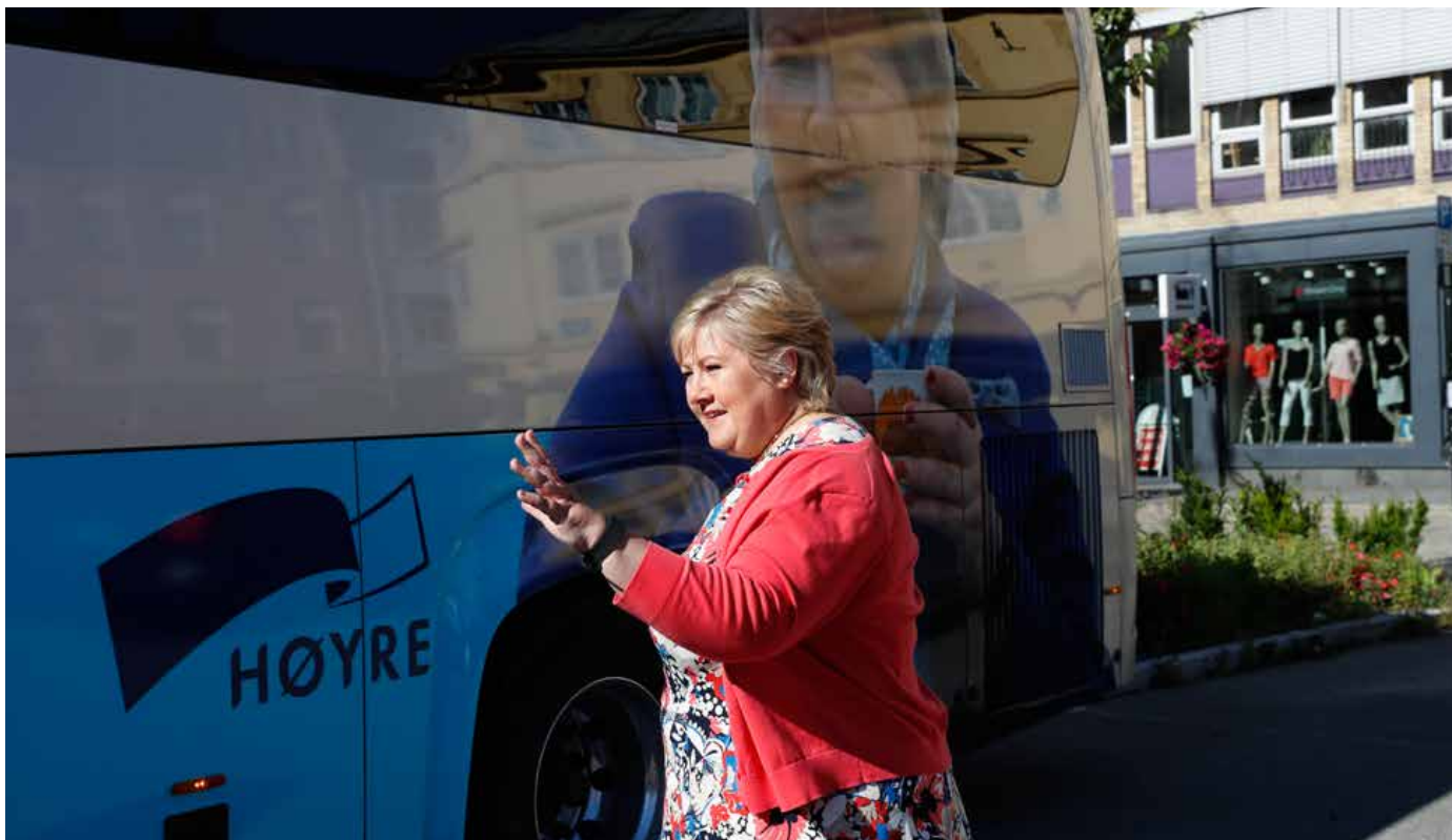
Erna Solberg er bekymret for det hun mener har vært et oppsving av høyreekstremer i Norge den siste tiden.