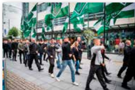
Gjennom Markens gate i Kristiansand marsjerte Nordisk motstandsbevegelse lørdag, og skapte kraftige reaksjoner over hele Norge.

– Vi får aldri til et regelverk som er så presist at det løser alle problemer. Men jeg tenker at man trenger bedre informasjon om hvordan reglene er å forstå. Utgangspunktet i grunnloven om ytringsfrihet er uklart for mange, og man kan bli nedslått av hvor lite kunnskap det er om ytringsfrihet og hvorfor vi har den. Det er ikke første gang det har vært en uanmeldt demonstrasjon, noen oppløses, noen oppløses ikke,