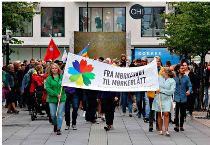
«Tverrpolitisk Ungdomsnettverk i Vest-Agder» kastet seg rundt og organiserte motdemonstrasjonen på under 24 timer.

– Det er viktig at alle har ytringsfrihet, og det mener jeg gjelder dem som demonstrerte lørdag også, mener han. ERLEND IVERSEN SKARSHOLT