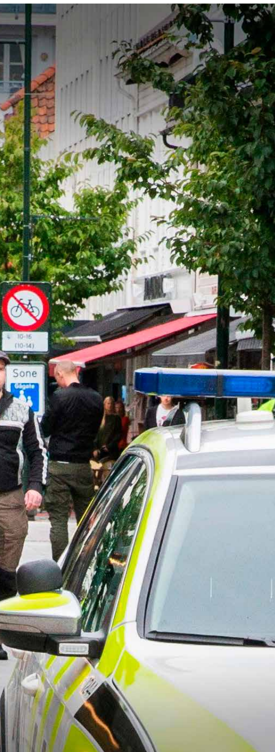
Her har nynazistene startet sin opptog på Markens lørdag formiddag med politibil foran og bak. Politiet aviser kritikk de har fått over at demonstrasjonen ikke ble stanset.