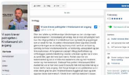
Mandag ettermiddag hadde over 440 likt Facebook-gruppa «Vi som krever politisjefen i Kristiansand sin avgang».

– Den argumentasjonen er bare tull. Vi mener det er en unnskyldning for ikke å gripe