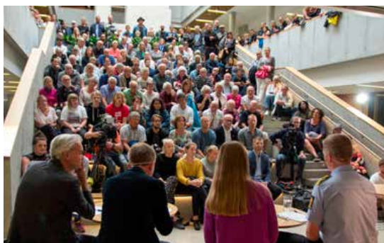
Over 200 møtte opp i amfi i Rådhuskvarteret torsdag kveld for å diskutere nazimarsjen.

– I Norge har vi ofte valgt å løse det slik at man lar en demonstrasjon gå, og så håndterer man eventuelt straffbare forhold etterpå knyttet til vold eller hatefulle ytringer. Det å stanse demonstrasjoner uten at det er fare for voldelige sammenstøt med grupperinger, og å kvele ting før de kommer til uttrykk, er ikke praksisen man har hatt i Norge.