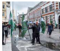
Nynazister demonstrerte i Kristiansand lørdag.

Symbolet ligner på en pil, eller bokstaven T, og betyr kamp og arv. Den symboliserer den norrøne guden Tyr. Symbolet ble blant annet brukt av SS-divisjonen «30. januar», årsda-