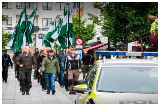
Politiet undersøker om det er begått straffbare forhold i forbindelse med helgens nazidemonstrasjon i Kristiansand. Flere personer skal ha blitt utsatt for legemskrenkelser under demonstrasjonen.

GEIR CHRISTIAN JOHANNESSEN, STEINAR VINDSLAND