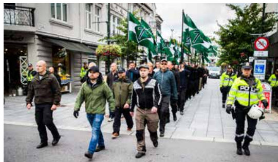
Av de 70 nazidemonstrantene var ifølge politiet 50 fra Sverige, 17 fra Finland og tre fra Norge.