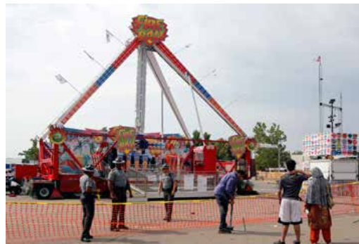
En 18 år gammel gutt døde i en ulykke med denne karusellen i USA.

TEKST: ROALD ANKERSEN roald.ankersen@fvn.no