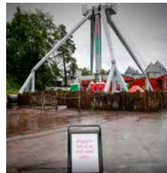
Dreggen er en populær attraksjon for ungdom i Dyreparken, men nå er den stengt.

En mann omkom og sju ble skadet i ulykken. Karusellen,