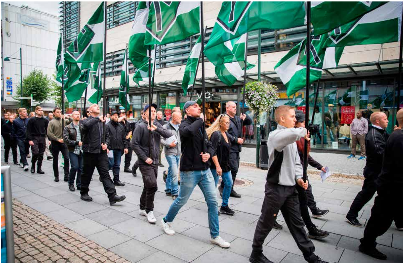
«Den nordiske motstandsbevegelsen» i Kristiansand er åpne tilhengere av Adolf Hitler og kaller seg nasjonalsosialister.