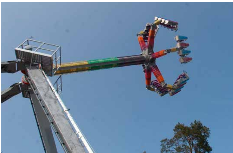
Dreggen er en av Dyreparkens skumleste attraksjoner og er populær blant ungdom.