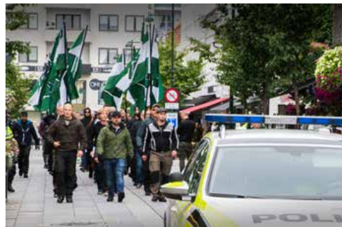
Politiet var tilstede, men grep ikke inn da en gruppe nynazister marsjerte i Markens lørdag 29. juli.