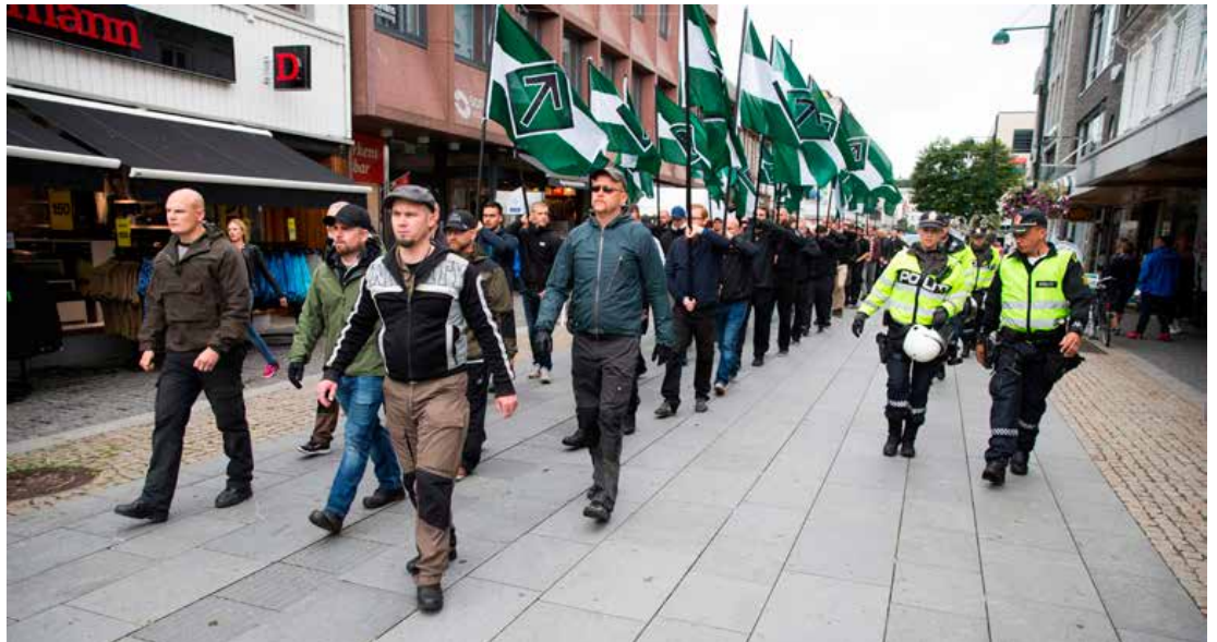
I utgangspunkt har eg respekt for enkelte i politiet på Sørlandet og eg har hatt eit godt samarbeid med dei dei siste åra, tross min motstand mot ein del instruksar frå Justisdepartementet, men det som hendte i Kristiansand 29. juli var at politiet gav etter for frykt, skriver artikkelforfatteren.

I vårt tilfelle var det neppe grunnlag for mistanke om ufredelige formål eller utartingar. Me var totalt syv menneskjer som satt på grasnet med symbol som gjaldt flyktningkrisa – redningsvest, handlagde skilt, eit lite telt som symbol for dei tusenvis av menneskjer og born som levde då og til den dag i dag i små kampingtelt rundt omkring i flyktningleir i Sør-Europa fordi