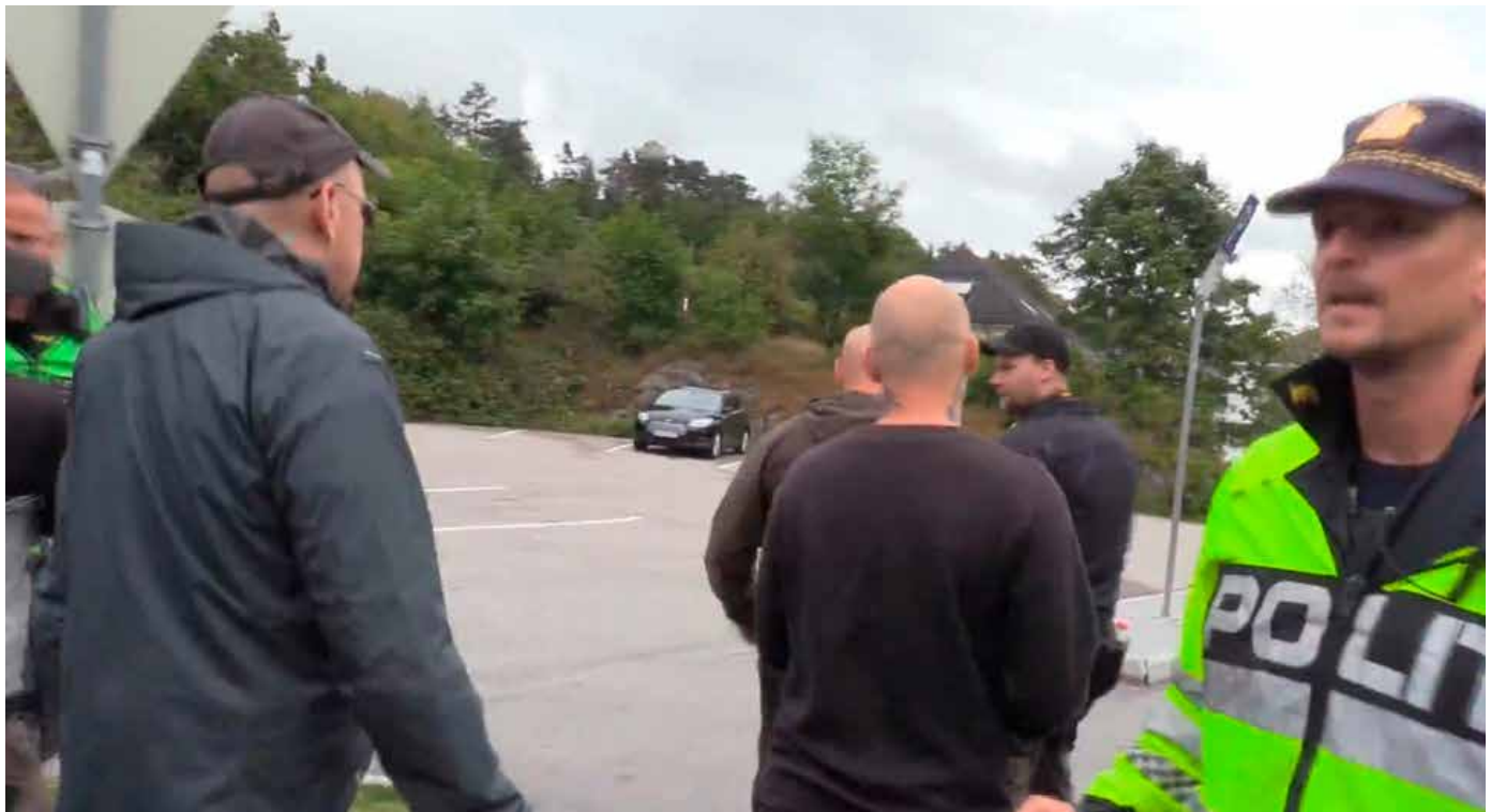
Demonstrasjonstøget har tatt form på vei fra kirkegården til gågata. Ved parkeringsplassen før Frobudalen beordrer politiet de selverklærte nazistene i Den Nordiske Motstandsbevegelsen til å stoppe.