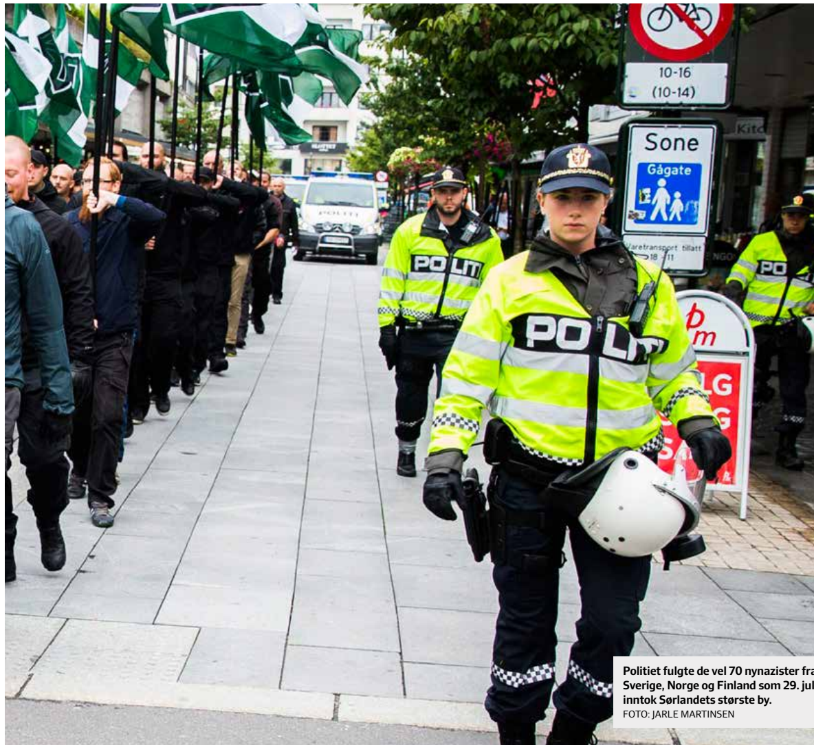
Politiet fulgte de vel 70 nynazister fra Sverige, Norge og Finland som 29. juli inntok Sørlandets største by.