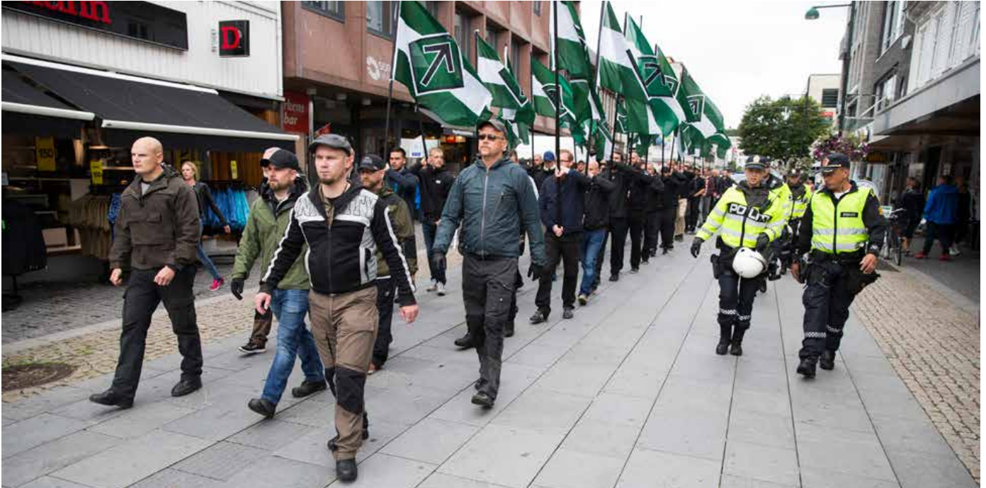
Den såkalte nordiske motstandsbevegelsens marsj gjennom Kristiansand lørdag formiddag opprørte mange.