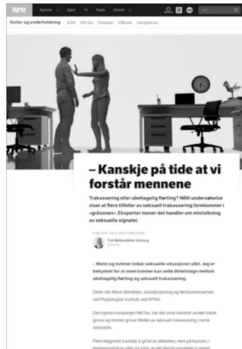
Figur 4: Faksimile hentet fra vedlegg 2, side 1.

«Skal jeg ikke kunne fortelle en dame at hun ser sexy ut?»