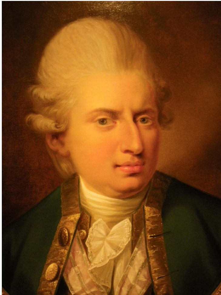
Johann Friedrich Struensee 1

”Den tyske præstesøn og læge Johann Friedrich Struensee er både hjemme og i utlandet den kendeste skikkelse i 1700-tallets Danmark. Trods alt hvad der er skrevet om ham, er han i midlertidig forblevet en gåde, en historisk skikkelse, som skiftende generationer har set og tolket ud fra egne normer og idealer.” 2