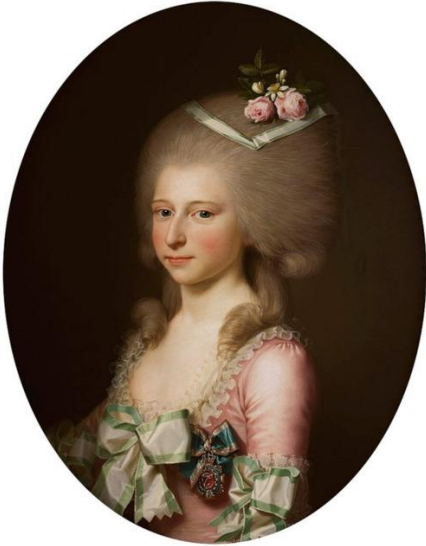
Louise Augusta, hvis far forblir et mysterium. 153