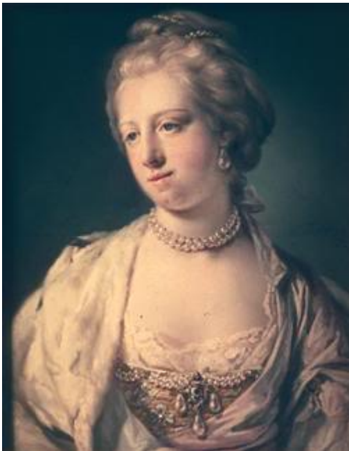
Caroline Mathilde, prinsesse av Wales, ca 15 år gammel Hun skulle senere slite med overvekt. 42

Fra sin periode i Altona hadde Struensee skaffet seg to viktige innskudd, nemlig økonomisk og sosial kapital. Med hjelp av legepraksisen fikk han pasienter og dermed inntekt. Jobben som lege gjorde ikke Struensee rik, men det var nok til at han kunne leve et behagelig liv. Lønnen skulle stige etter at han ble ansatt som kongens reiselege. På samme tid skaffet han seg også en sosial kapital. Som tidligere nevnt var mange av pasientene til Struensee fra det høyere samfunnslag, og han ble etter hvert en del av dette. Han fikk kontakter og bekjente, og han fikk en sosial kapital som til slutt skaffet han jobben som Christians reiselege da dette var en jobb han ble anbefalt til av personer ved hoffet. Etter at Struensee kom til hoffet skaffet han seg politisk kapital. Han hadde hatt politiske ideer fra sin tid i Altona, men i København skulle han få sjansen til å få satt de ut i livet.