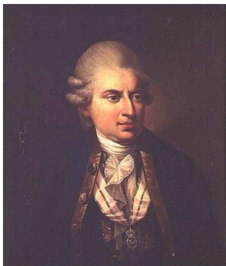
Ikke alle portretter av Struensee er like veltalende 120

uredd. Det er Struensees handlinger og intensjoner som får han opp og frem, men det er hele tiden en negativ undertone. Eksempelvis er forholdet med Caroline Mathilde beskrevet som lidenskapelig og ekte fra hennes side, mens for Struensee er forholdet overfladisk. Han utnytter henne. Utnyttet han også Christian? Utnyttet han Danmark?