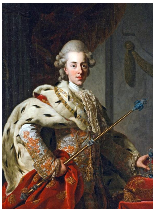
Christian VII av Danmark og Norge 32

Frederik Vs aversjon mot å styre førte til at ansvaret i realiteten ble overlatt til en person kongen hadde tillitt til. Kongens hoffmarskalk og personlige venn Adam Gottlob Moltke forvaltet enevoldsmakten i tjue år. I opplysningens ånd var det blitt moderne å reformere samfunnet, og dette gjorde seg også gjeldende for lederne av den danske staten. 31 Uenighetene dreide seg mer om tempoet for reformene enn reformene i seg selv. Frederik V ønsket reformer og sammen med Moltke lyttet han til folket. Også på det økonomiske felt kom det reformer. Statsadvokat og senere statsminister Henrik Stampe sto fra 1750 for en glidende overgang til økonomisk liberalisering. Dessuten hadde nøytralitetspolitikken ført til at rikene opplevde en vekst i næringslivet som ga staten gode inntekter i form av skatt og toll.