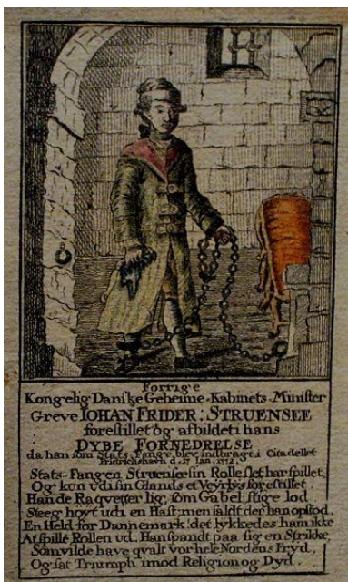
Bildet viser Struensee i Kastellet, lenket og avbildet ”i sin dybe

1772 ble Balthasar Münter, prest ved den tyske menighets kirke Skt. Petri, utnevnt av ”Inkvisisjonskommisjonen” til å være Struensees sjelesørger og skriftefar. Enevold Brandt fikk presten Jørgen Hee som skriftefar. Han skulle også utgi sine beretninger om deres samtaler etter henrettelsen. Struensee var ateist. Han ville trolig få et bedre ettermæle blant samtidens kristne dersom han ble omvendt, selv om det ikke uten videre skal sås tvil om Münters intensjoner. Struensee trengte en skriftefar som intellektuelt var som han selv. Brandt var i motsetning til Struensee en munter mann som elsket forlystelser. Han var ikke ateist, så det holdt lenge med en gjennomsnittlig konservativ teolog som Hee som kunne føre han tilbake til den barndomsreligionen som Brandt egentlig aldri hadde forlatt. 70 Struensee var derimot en mann som fullt og helt delte den franske antireligiøse opplysningens idealer.