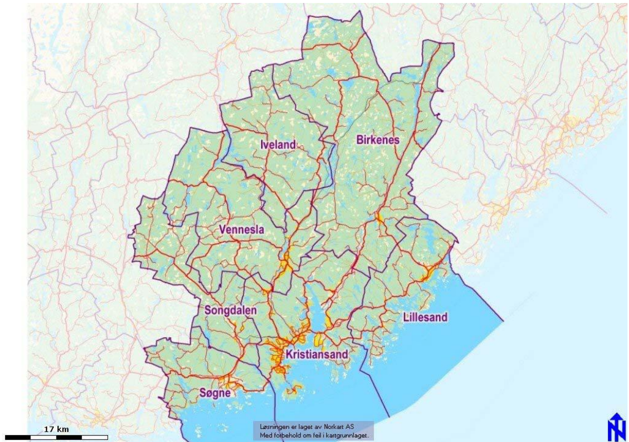
Figur 4.2 Kristiansandsregionen (Knutepunkt Sørlandet)

( http://www.knutepunktsorlandet.no/artikkel.aspx?AId=86&back=1&MIId=183 , 27.10.2010)