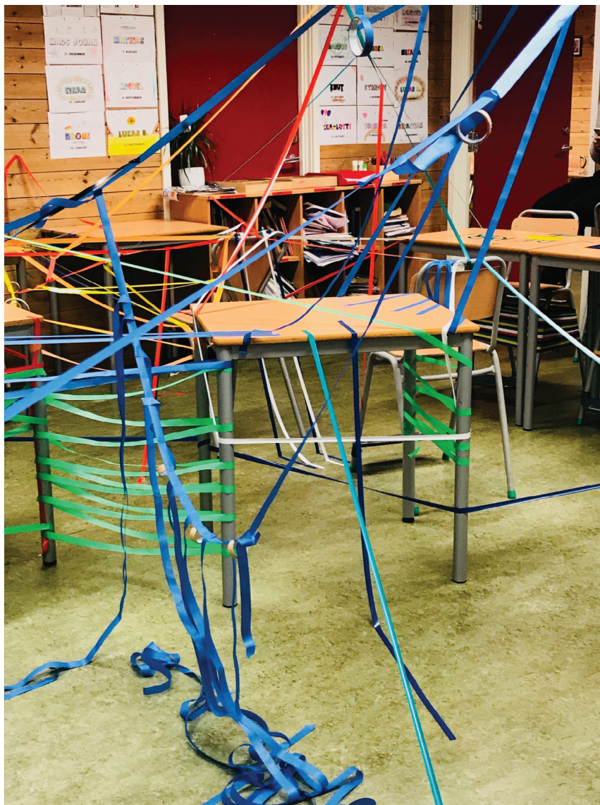
Figur 1. Fra Sandra Norrbins DKS-prosjekt «Teiporama», Kringsjå skole 2019. Foto: Lisbet Skregelid. Lisens: CC BY-NC-ND.