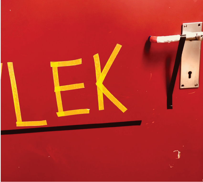
Figur 3. Kan tekstanalyse anses som en lek? Fra Sandra Norrbins DKS-prosjekt «Teiporama», Kringsjå skole 2019. Foto: Lisbet Skregelid. Lisens: CC BY-NC-ND.