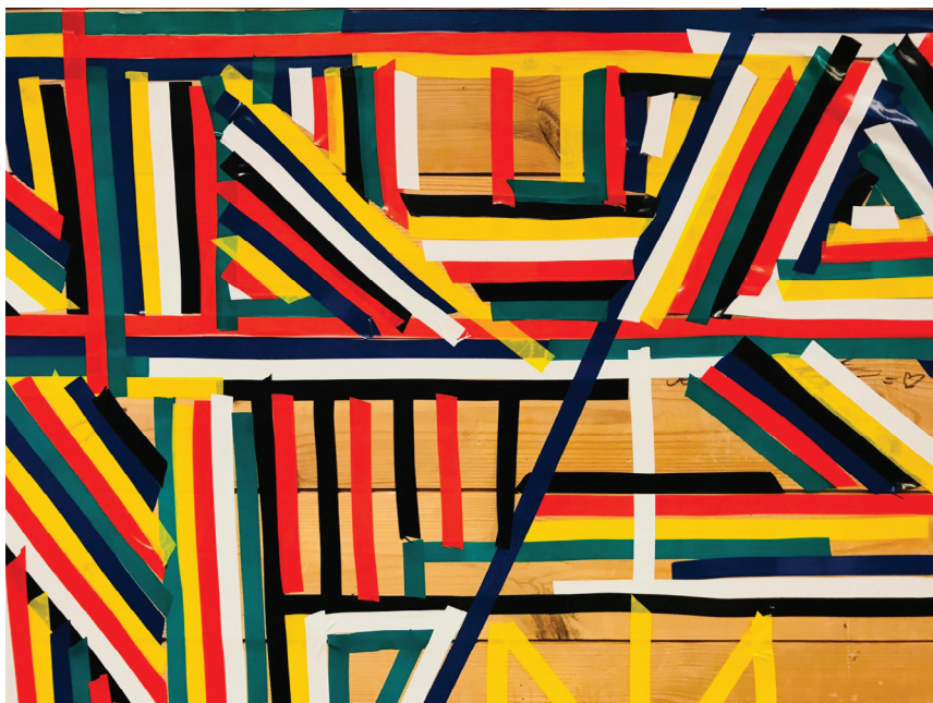
Figur 4 og 5. Fra Sandra Norrbins DKS prosjekt «Teiporama», Kringsjø skole 2019. Foto: Lisbet Skregelid. Lisens: CC BY-NC-ND.