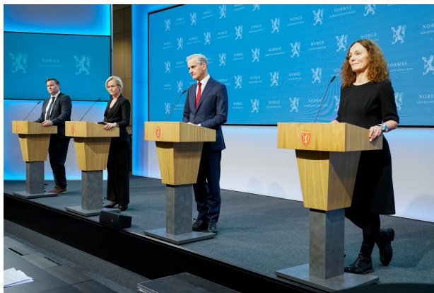
Bilde 1. 2021, ( https://www.ba.no/nye-koronatiltak-tredje-vaksine-til-alle-voksne-og-bruk-av-koronapass-innenlands/s/5-8-1743103).

Ved introduksjonen av bildene kom det fort frem at deltakerne hadde mange forskjellige tanker om vaksinerings, koronasituasjonen og myndigheter. Ved å sette ord på det de så på bildene og drøfte de umiddelbare tankene rundt dem fikk jeg en slags inngang til hvor mistilliten deres var rettet tidlig i intervjusituasjonen.