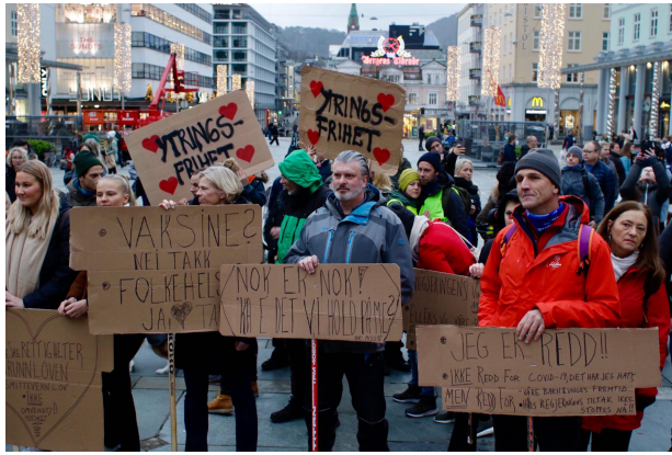
Bilde 2. 2020.

Bilde 2, av demonstrasjonen, var det derimot flere av deltakerne som kjente seg igjen i og hadde sympati for. «Her, når jeg ser på bilde 2, det første jeg ser er jo ytringsfrihet og det varmer jo mitt hjerte[...] Denne relaterer jeg jo til» (Noah).