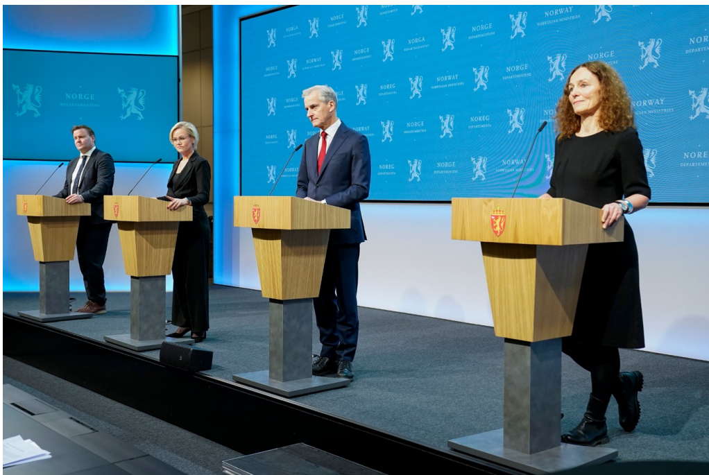
Bilde 1. 2021

Under ligger bildene jeg brukte i intervjuene. Bilde 1 er et fotografi tatt under en pressekonferanse om koronasitasjonen i Norge november 2021. Dette er et fotografi av assisterende helsedirektør Espen Rostrup Nakstad, Helse- og omsorgsminister Ingvild Kjerkol, statsminister Jonas Gahr Støre og FHI-direktør Camilla Stoltenberg.