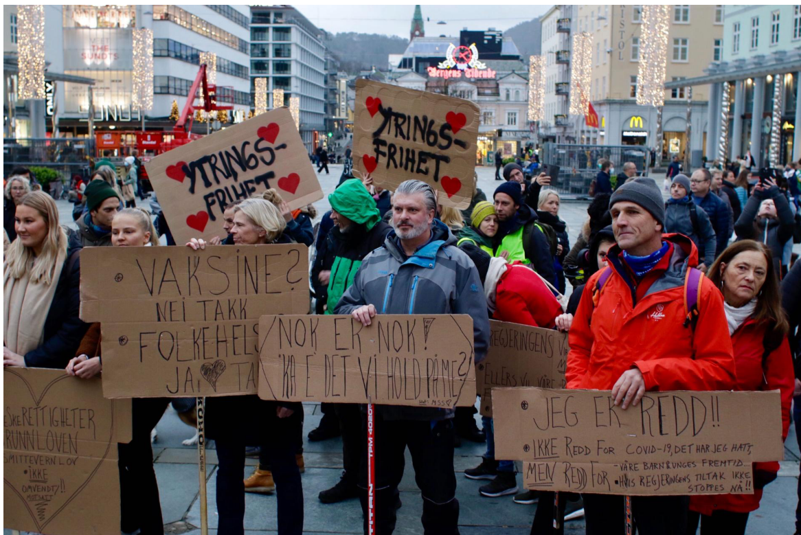
Bilde 2. 2020, av Ørjan Deisz. ( https://www.bt.no/nyheter/lokalt/i/86GzLG/de-savner-alternative-stemmer-i-koronadebatten ).

Det andre bildet jeg la frem i intervjuene er tatt under en demonstrasjon i Bergen, november 2020. På Bilde 2 er det en gruppe mennesker som holder plakater hvor det står skrevet ting som «Ytringsfrihet» dekorert med hjerter rundt, «Vaksine? Nei takk. Folkehelse? Ja takk», «Nok er nok! Ka e det vi hold på me?» og «Jeg er redd!! Ikke redd for covid-19, det har jeg hatt. Våre barn og unges fremtid. Men redd for hvis regjeringens tiltak ikke stoppes nå!!».