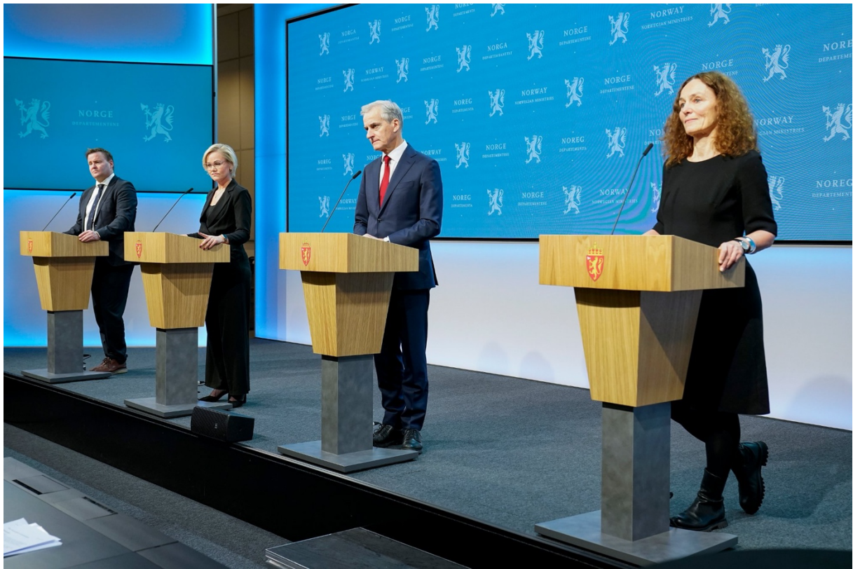
Bilde 1. 2021