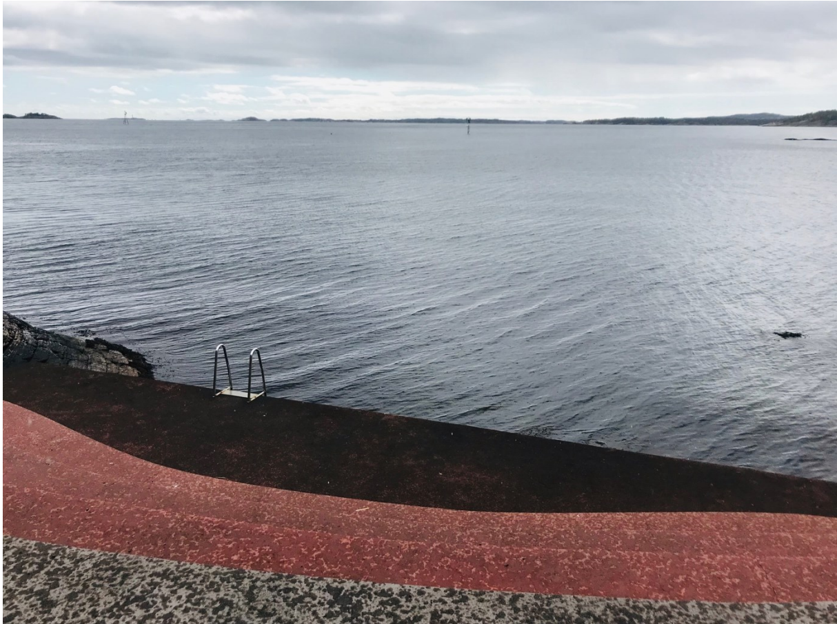
Figur 2. Hindere, som lager skille mellem havet og meg selv.