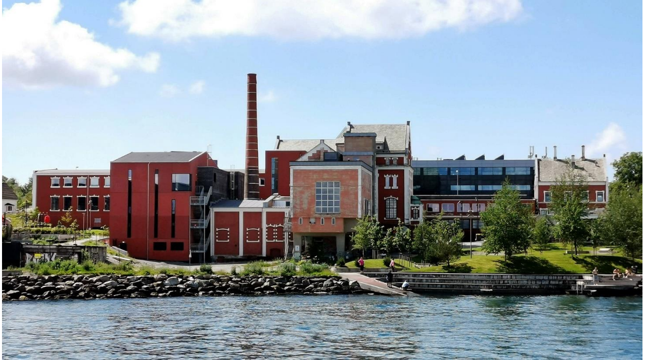
(Figur 4. Tou Scene sett fra havet.)

viktig møteplass for byen, samt regionens kunstnere, men det er også en viktig møteplass for byens befolkning. Den sjønære beliggenheten til Tou Scene, samt parken ved siden av (se figur 4) gjør Tou Scene om til et populært møtested for bydelen og byen. Tou Scenes serveringsaktivitet samt kulturelle aktiviteter forsterker Tou Scene som møtested.