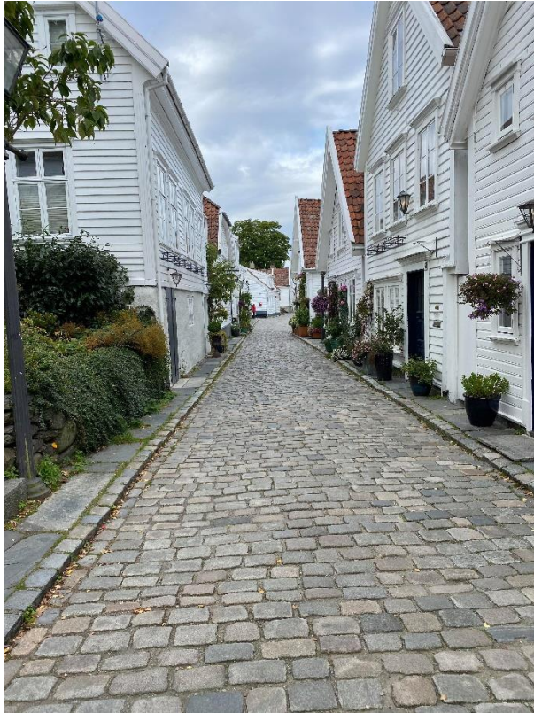
(Figur 2, Gamle Stavanger, av Kristoffer Kalleli)