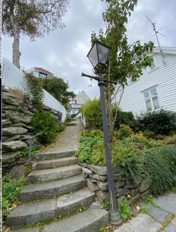
(Figur 3, Gamle Stavanger, av Kristoffer Kalleli)