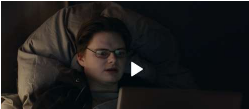
Bilde 9: Skjermdump av karakteren Mats, hentet fra dplay.no «Sigurd fåkke pult» (2020) sesong 1, episode 1 https://www.discoveryplus.no/programmer/sigurd-fakke-pult (07:31)

som en streber, som en som prøve å leve opp til de hegemoniske mannlighetsidealene, spør Mats gjentatte ganger hvorfor man skal prøve å være noen man ikke er. Han har akseptert sin umannlighet.