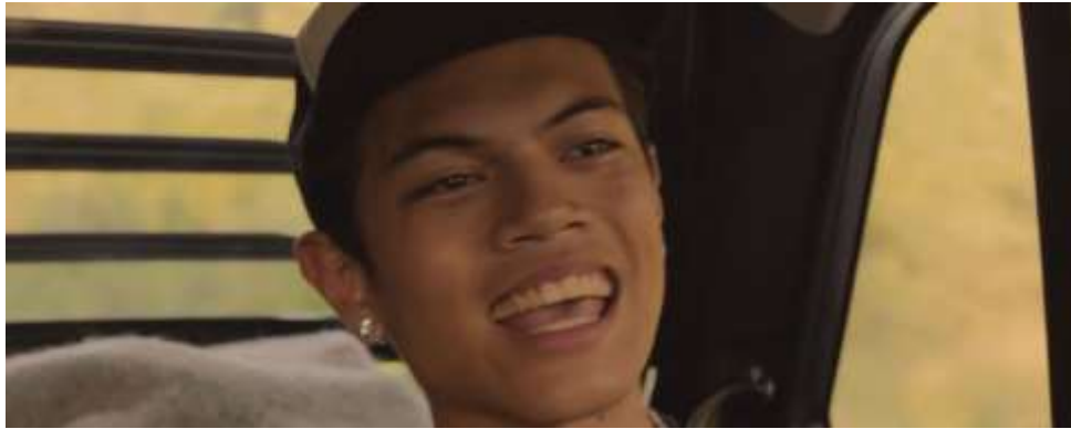
Bilde 3: Skjermdump av karakteren Kim, hentet fra Nrk.no «Rådebank» (2020), sesong 1, episode 1 https://tv.nrk.no/se?v=MYNT10000120&t=53s (00:51)

Kim: Han er også en viktig karakter for Glenn Tore, men en karakter som ikke får på langt nær så mye skjermtid som Sivert. Foreldrene hans er av asiatick opprinnelse. Han er den eneste man vet nøyaktig alder på, da han fyller 18 år i løpet av sesongen. Moren driver den lokale asiaticke restauranten. Kim blir ved gjentatte anledninger offer for Glenn Tore sitt temperament.