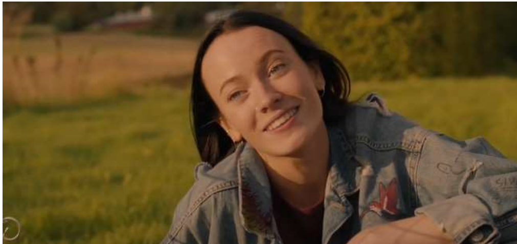
Bilde 5: Skjermdump av karakteren Hege, hentet fra Nrk.no, «Rådebank» (2020) sesong 1, episode 1 https://tv.nrk.no/se?v=MYNT10000120&t=1067s (17:41)

Hege: Vennegjengens eneste jente, men allikevel en del av «gutta». Hun har svart hår med fargede røde tupper, og har en ganske «guttejente» i fremtoning i både klesvalg og holdning. Hun bruker i all hovedsak mørke klær. Dette står i direkte kontrast med seriens andre kvinnelige karakterer; Ine og Marlene som begge er veldig jentete fremstilt, slik jeg tolker det. Serieskaperne går langt i å fremme det at Hege og Ine aldri var noe gode venner, mye fordi Hege også hadde/har følelser for Glenn Tore.