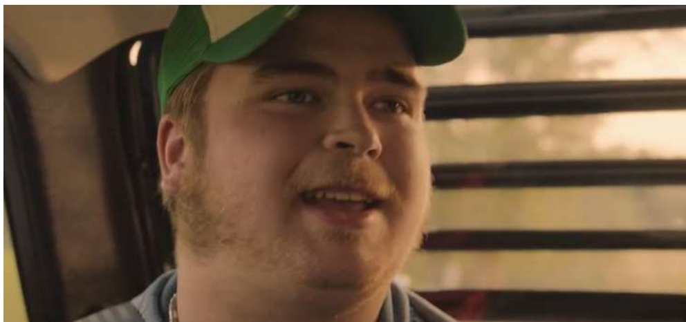
Bilde 4: Skjermdump av karakteren Robert Nilsen, hentet fra Nrk.no, «Rådebank» (2020), sesong 1, episode 1 https://tv.nrk.no/se?v=MYNT10000120&t=68s (01:08)

Robert Nilsen: Den eneste karakteren som blir nevnt ved etternavn. Dette nok en karakter som vi ikke ser så mye til, og som er sammen med Kim når han først er der. Han er en robust kar, sett mot de tre nevnt ovenfor. Han har Henriquate 2 , og er alltid å se med en caps det står «Felleskjøpet» på.