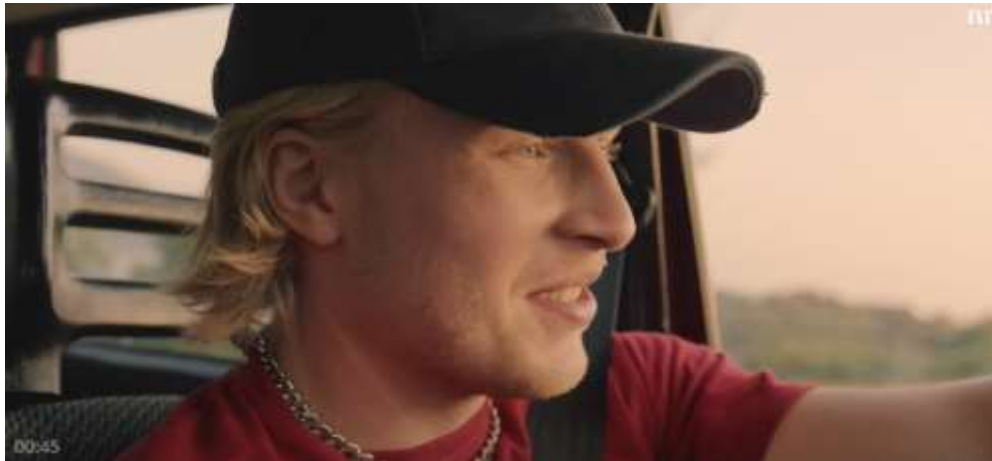
Bilde 1: Skjermdump av karakteren Glenn Tore.

Glenn Tore: Seriens hovedperson. Går ved kallenavn GT . Han har blondt halvlangt hår, er bredskuldret og ganske høy. Han er oftest å se med en blå kops, den røde arbeids t-skjorta det står «Bø Auto» på, og en sølvlenke rundt halsen. Ved finere anledninger, som en fest, så blir den røde arbeidsskjorta byttet ut med en hvit t-skjorte og en flanell over. Han kjører Volvo 240.