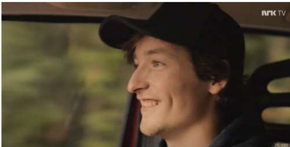
Bilde 2: Skjermdump av karakteren Sivert, hentet fra Nrk.no, «Rådebank» (2020) sesong 1, episode 1 https://tv.nrk.no/se?v=MYNT10000120&t=49s (00:51)

Sivert: Glenn Tores bestevenn, og hovedkarakter i sesong to. Han er spedere enn Glenn Tore. Han har brunt hår, og også han er oftest å se med caps på hodet. Sivert skiller seg ut ifra de andre vennene, fordi han er «boksmart». Han har en drøm om å studere på NTNU, og har en tendens til å google alle spørsmål. Det blir titt og ofte kastet en kommentar hans vei om akkurat dette.