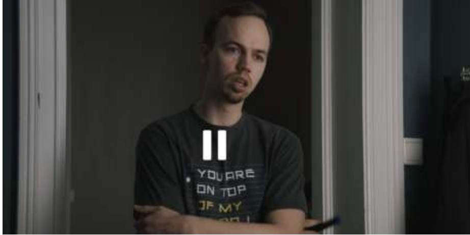
Bilde 11: Skjermdump av karakteren Torm, hentet fra Dplay.no, «Sigurd fåkke pult» (2020), sesong 1, episode 1 https://www.discoveryplus.no/programmer/sigurd-fakke-pult (02:00)

Trym: Den tidligere romkameraten til Sigurd. Han er lavere enn Sigurd, har brunt hår, og er noe hengslete i kroppen. Han flytter ut allerede i den første episoden, og tar med seg alt som er hans i leiligheten de leier sammen.