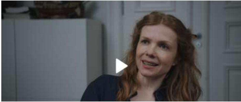
Bilde 13: Skjermdump av karakteren som psykologen, hentet fra Dplay.no «Sigurd fåkke pult» (2020) sesong 1, episode 1 https://www.discoveryplus.no/programmer/sigurd-fakke-pult (10:09)