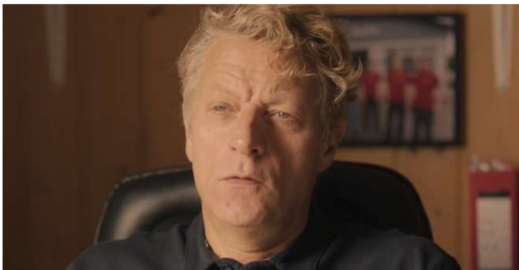
Bilde 6: Skjermdump av karakteren Stein-Roar, hentet fra Nrk.no, «Rådebank» (2020) sesong 1, episode 3 https://tv.nrk.no/se?v=MYNT10000320&t=10s (01:57)

Stein-Roar: Glenn Tore sin sjef på Bø Auto. Den eneste voksne karakteren i serien som blir satt i et godt lys, og som får relativt mye plass i historien. Han er en gift, høy mann som er godt etablert med egen bedrift.