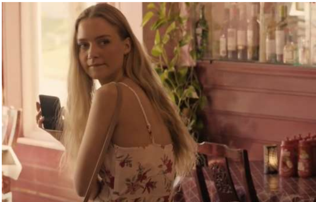
Bilde 7: Skjermdump av karakteren Ine, hentet fra Nrk.no «Rådebank» (2020) sesong 1, episode 2 https://tv.nrk.no/se?v=MYNT10000220&t=613s (10:13)

Ine: Ekskjæresten til Glenn Tore. En søt og yndig jente, med blondt hår og et rolig vesen. Hun har ikke noen av de samme fysiske markørene som råneren i serien. Hun går i søte sommerkjoler, i alle slags pastellfarger. Hun og Glenn Tore var sammen i nesten tre år, før hun gjorde det slutt fordi hun skulle flytte ifra Bø og studere. I byen gjennomgår hun en del forandringer, som blir vanskelig for Glenn Tore å takle.