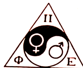
Figur 3: Symbol brukt på forsiden til tidsskriftet Feminform .

I utgivelser av Feminform på 1970- og 1980-tallet var det på forsiden en trekant med initialene til FPE i greske bokstaver i hvert hjørne av trekanten og et yin yang symbol i midten hvor man ser den ene halvdel har et mannlig/maskulint symbol og den andre et kvinnelig/feminint symbol, se Figur 3. Denne figuren ser ut til å fungere som en passende representasjon for hvordan det å være transvestitt ble oppfattet blant medlemmene. Uttalelser som det å leve i harmoni med både mannen og kvinnen i seg eller det å få lov til å være et «helt menneske» gikk igjen. 575 For noen kunne det å kle seg om være mer en hobby, 576 mens for de aller fleste var dette av ren nødvendighet. Det blant annet beskrevet at en undertrykking av den kvinnelige siden kunne ha negative konsekvenser som for eksempel å påvirke ens mental helse. 577