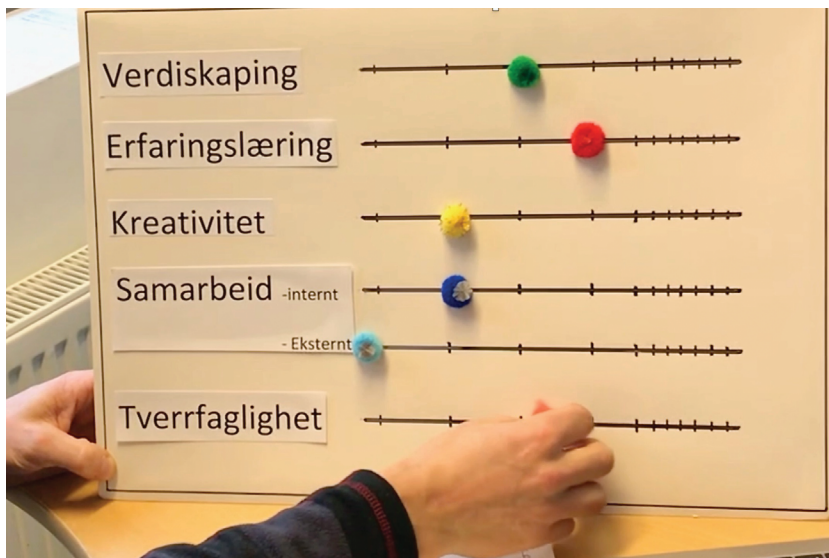
Bilde 1. Miksepult for pedagogisk entreprenørskap. Lesvos, september 2018. Foto: Vemund Ruud. Gjengitt med tillatelse.

Gir vi elevene trening i kreativitet og problemløsning, kan de bidra til å forbedre familier, organisasjoner og firmaer ut fra sitt ståsted. Målet må være å gi elevene en læring som de bærer med seg, og som inspirerer dem som mennesker hele livet. Slik at vi alle bidrar til verdiskapingen i det samfunnet vi lever i. (Aase, 2015, s. 26)