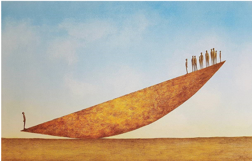
Bilde 2. «I am important, I make a difference» av Tom Erik Andersen. Gjengitt med tillatelse.

Jeg har deltatt i mange råd og utvalg, både på UiA og som UiA sin representant i samarbeid med andre organisasjoner. Det har gitt meg god kontakt med studentrepresentanter og eksterne rådsmedlemmer.