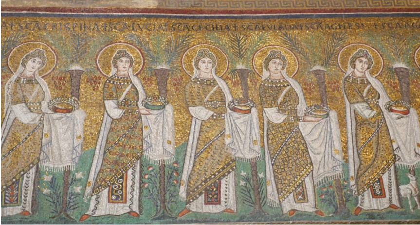
Fig. 1: Santa Lucia i prosesjon med andre jomfruhelgener, fra Sant'Apollinare Nuovo i Ravenna.

er øynene på et fat, okser og lyst hår. Legenda Aurea , middelalderens mest populære bok og kalender, forteller at 13. desember minner Lucias Dies natalis , den dagen hun dør fra det jordiske liv og fødes inn i himmelen. Grunnen til at Lucia fikk så sterkt fotfeste i Nord-Europa, har nok i stor grad med mørketiden å gjøre. 13. desember ble tradisjonelt regnet som dagen for solsnu, og det at navnet hennes kommer fra ordet lux , som betyr «lys», passet fint med overgangen til lysere tider. I motsetning til andre jomfruhelgener, som Cecilia (med minnedag 22. november) og Agnes (21. januar), ligger det allerede i Lucias navn et meningspotensiale som passer særlig godt i den skandinaviske konteksten, og som forsterkes av de hvite draktene, lysene og kronen til prosesjonsdeltakerne.