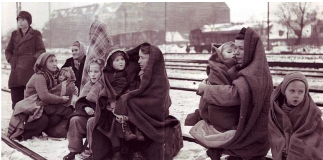
Tyske barn og kvinner på flukt et sted i det østlige Tyskland februar 1945.

utbrøt fullt kaos blant de flyktende menneskene. Sovjetiske stridsvogner brøt gjennom i sør og mange sivile flyktet mot kysten. Vinteren var kald og de fleste flytningene hadde kun fått med seg noen få ting av deres eiendeler. Mange tusen omkom som følge av at de ble fanget i kampene eller de døde av kulde og utmattelse under flukten. 73 For å hjelpe flyktingene med å komme seg vekk, igangsatte den tyske marinen en stor operasjon for å evakuere de flyktingene som var fanget i havnebyene Danzig og Gotenhafen.