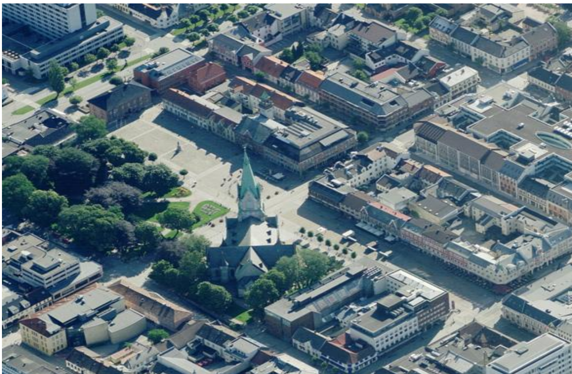
Bilde 1

Denne oppgavens case er Torvet p – anlegg. Studien vil være konsentrert om denne planprosessen og den endelige beslutningen i denne saken.